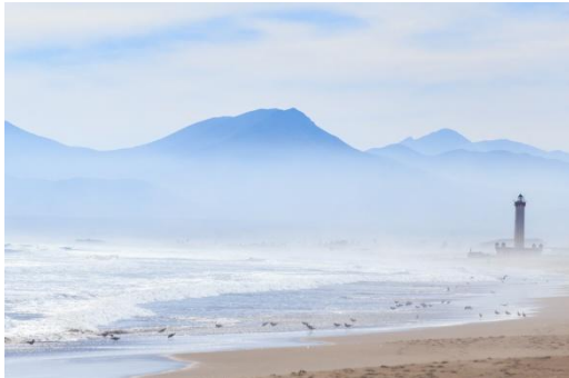
La Serena

Individuelle Anreise nach La Serena. Der Rest des Tages steht zur freien Verfügung. 5 Übernachtungen: Hotel Diego De Almagro La Serena***+