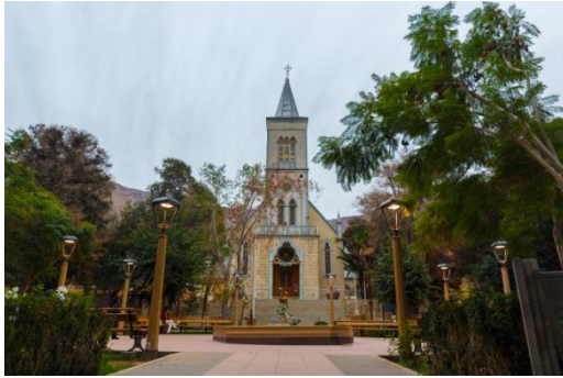
Im Elquí-Tal