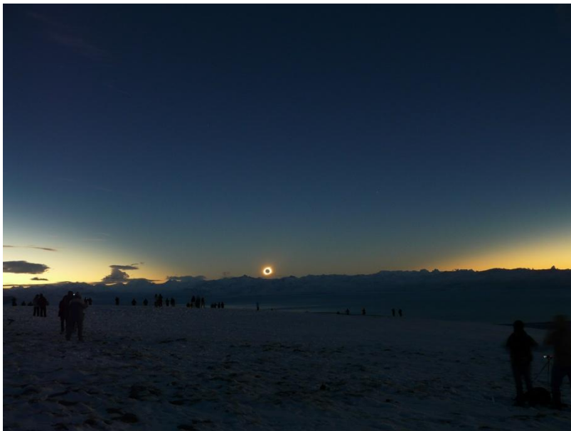
Totale Sonnenfinsternis Argentinien 2010

Abends nach Rückkehr vom Beobachtungsort SoFi-Dinner.