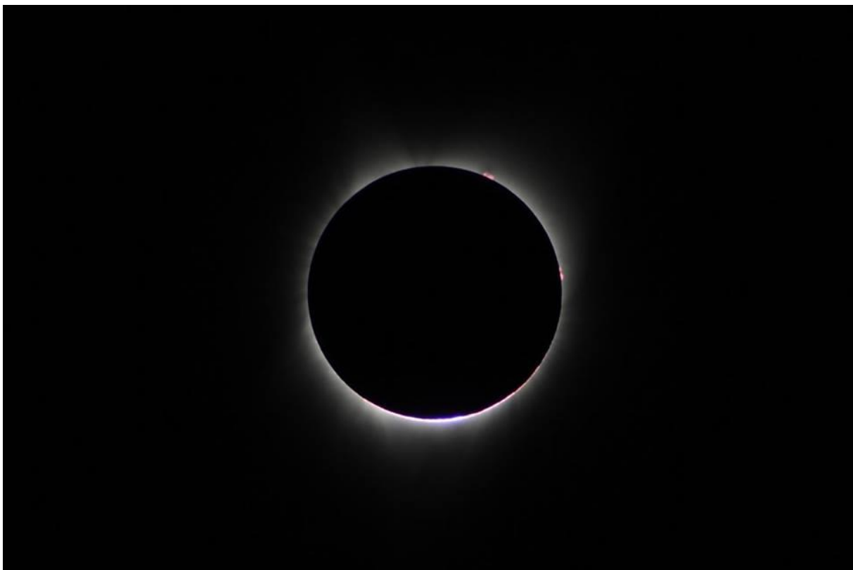
Totale Sonnenfinsternis am 21.08.2017 in Oregon